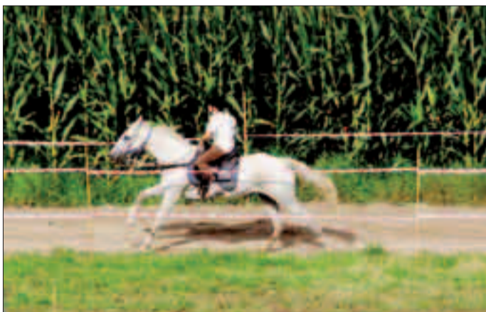
La festa dell'agricoltura in una delle precedenti edizioni

LOMASO - Prende il via stasera con il festival delle colonne sonore e il concerto della Vanilla Sky Band il classico appuntamento ferragostano con la «Festa dell'Agricoltura - Palio dei 7 comuni», manifestazione organizzata dal Comitato di Vigo Lomaso e Dasindo e che negli oltre vent'anni di storia ha registrato una costante crescita, tanto da esser conosciuta anche oltre i confini provinciali. Quest'anno due sono le novità che vanno ad affiancarsi al tradizionale programma fatto di arte, mostre di animali, enogastronomia, corse di cavalli e musica con epicentro il piazzale Copag di Dasindo. Tanto per cominciare, domani mattina dalle 10 l'unione degli allevatori delle Giudicarie e Copag organizzano la tavola rotonda «Quale futuro per la